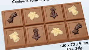
HB-9045-S Tafel Weihnachten Confiserie Form 275 x 175 mm