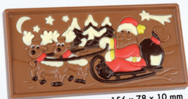
HB-9022-S Weihnachtstafel Confiserie Form 275 x 175 mm