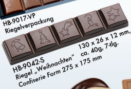
HB-9042-S Riegel „Weihnachten“ Confiserie Form 275 x 175 mm